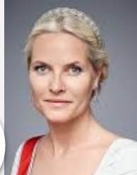
H.R.H. Crown Princess Mette-Marit of Norway

Group CEO and Managing Director, King Abdullah Economic City, Saudi Arabia