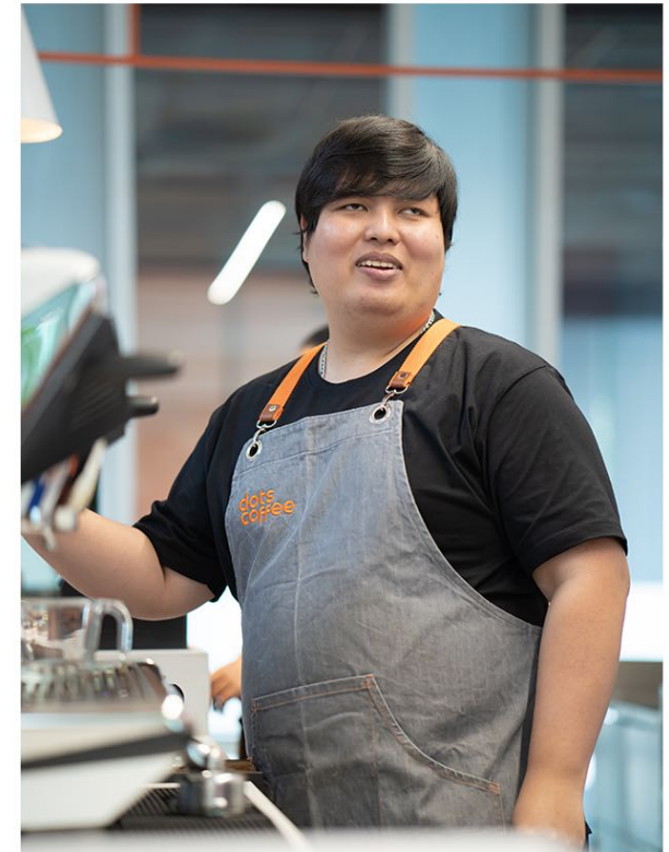
แรงบันดาลใจ