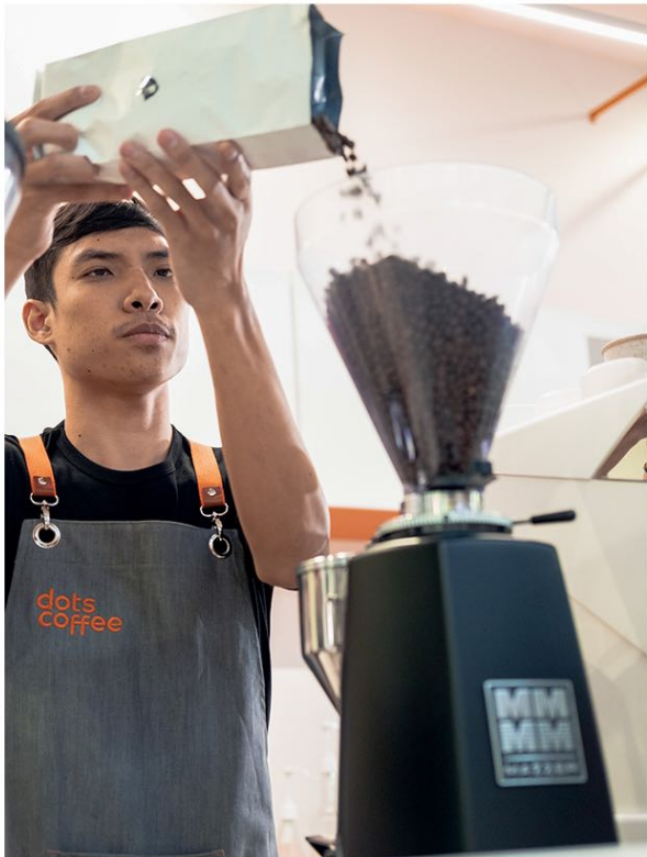
ความเป็นมืออาชีพ