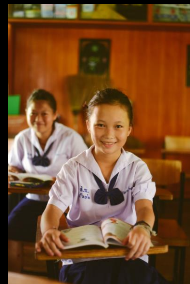
เปลี่ยนรายได้ให้เป็น “โอกาสทางการศึกษา”