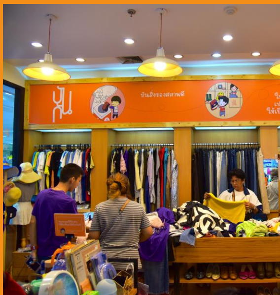
นำมาเป็น “สินค้าแบ่งปัน” จำหน่ายในราคาย่อมเยา