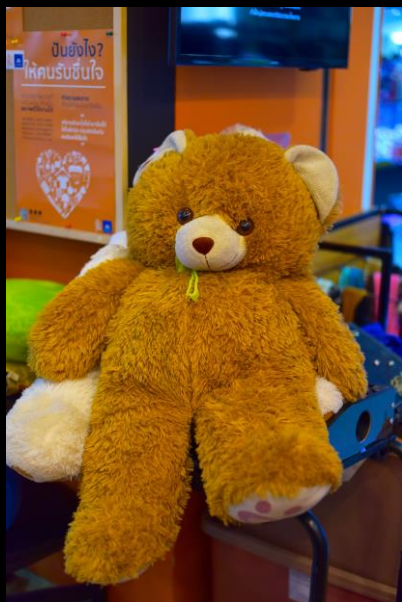
รับปัน สิ่งของสภาพดี

สร้างการมีส่วนร่วม เพื่อประโยชน์แก่สังคมอย่างยั่งยืน