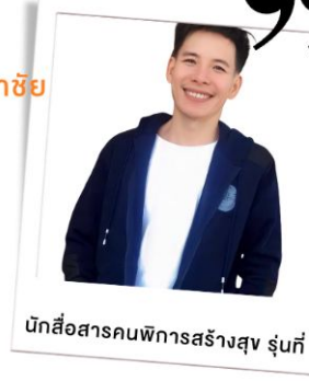
นักสื่อสารคนพิการสร้างสุข รุ่นที่ 1