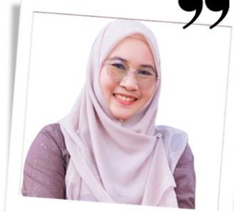
นักสื่อสารคนพิการสร้างสุข รุ่นที่ 1