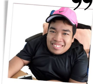
นักสื่อสารคนพิการสร้างสุข รุ่นที่ 1