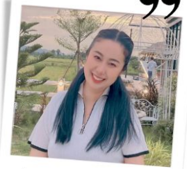
นักสื่อสารคนพิการสร้างสุข รุ่นที่ 1