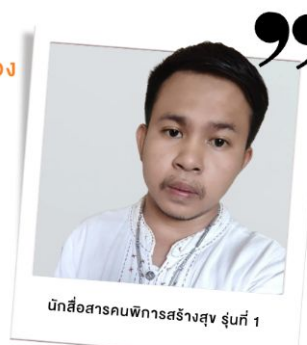
นักสื่อสารคนพิการสร้างสุข รุ่นที่ 1