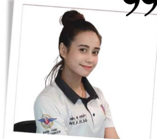
นักสื่อสารคนพิการสร้างสุข รุ่นที่ 1