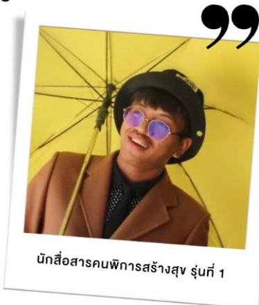
นักสื่อสารคนพิการสร้างสุข รุ่นที่ 1