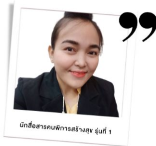
นักสื่อสารคนพิการสร้างสุข รุ่นที่ 1