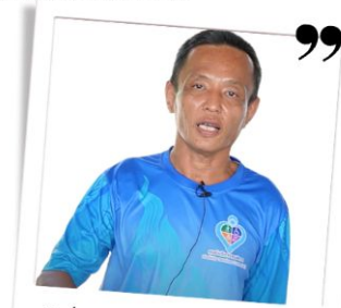
นักสื่อสารคนพิการสร้างสุข รุ่นที่ 1