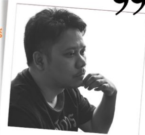
นักสื่อสารคนพิการสร้างสุข รุ่นที่ 1