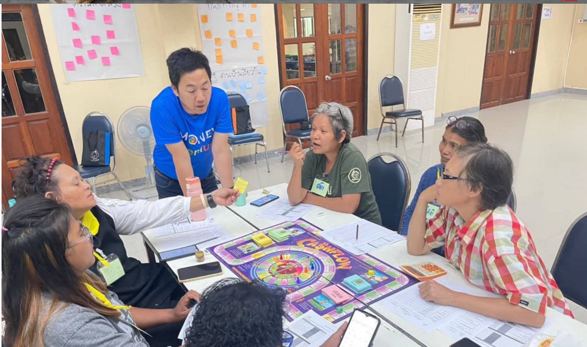
TSV ประเด็น "ยุทธการปลดหนี้" ช่วยคนไทยพ้นวังวนหนี้ ด้วยทุนชีวิต-เครือข่าย