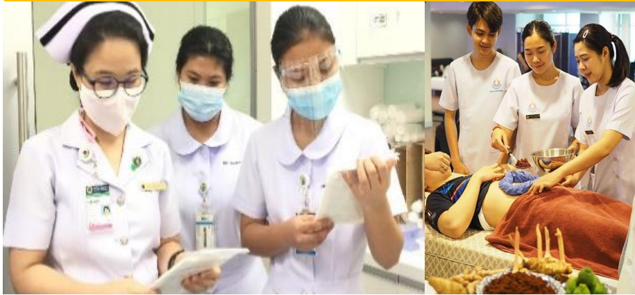
Practical Nurse/ Dental assistant/ Prosthetist