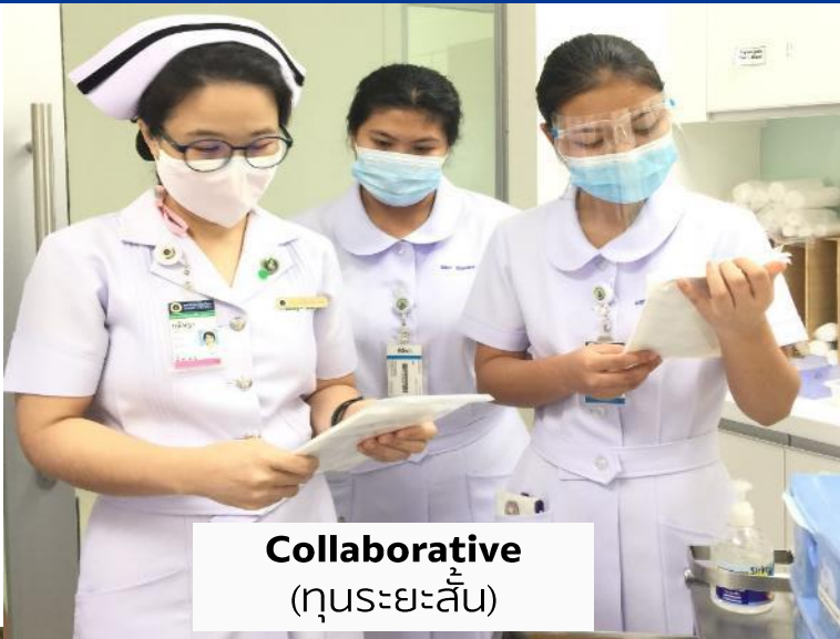
Collaborative (คุณระยະสัน)