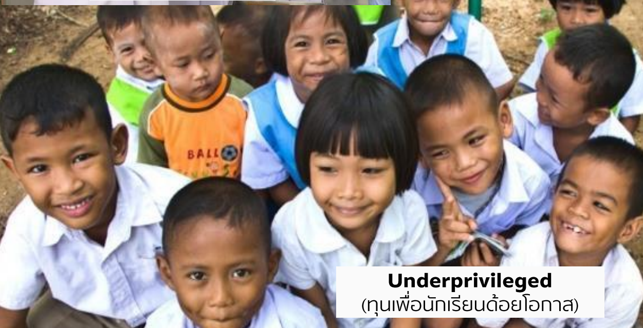
Underprivileged (คุณเพื่อนักเรียนด้อยโอกาส)