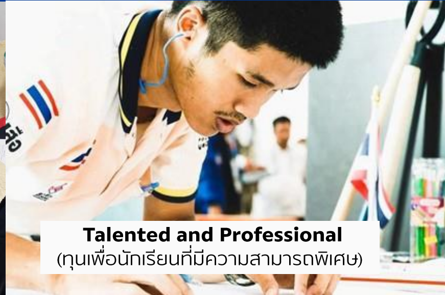
Talented and Professional (คุณเพื่อนักเรียนที่มีความสามารถพิเศษ)