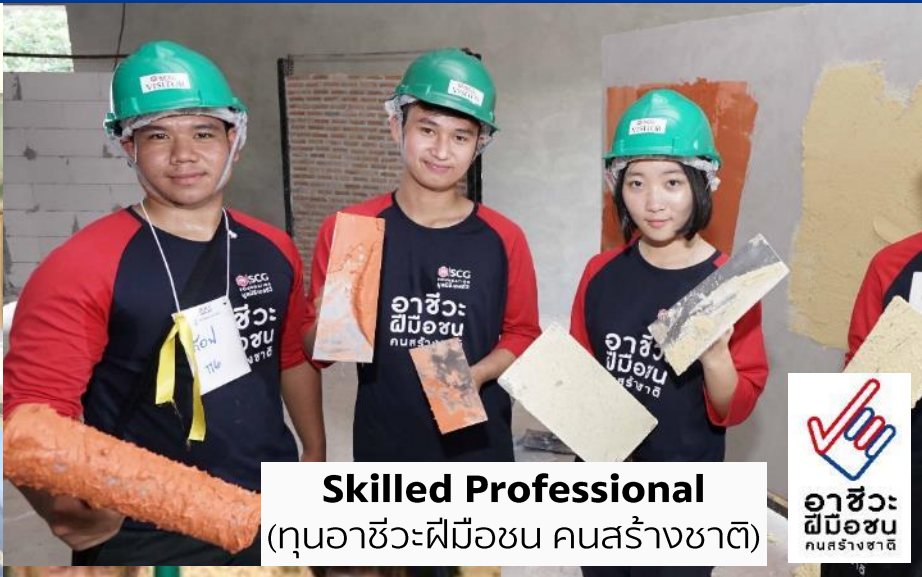
Skilled Professional (คุณอาชีวะฝีมือชน คนสร้างชาติ)