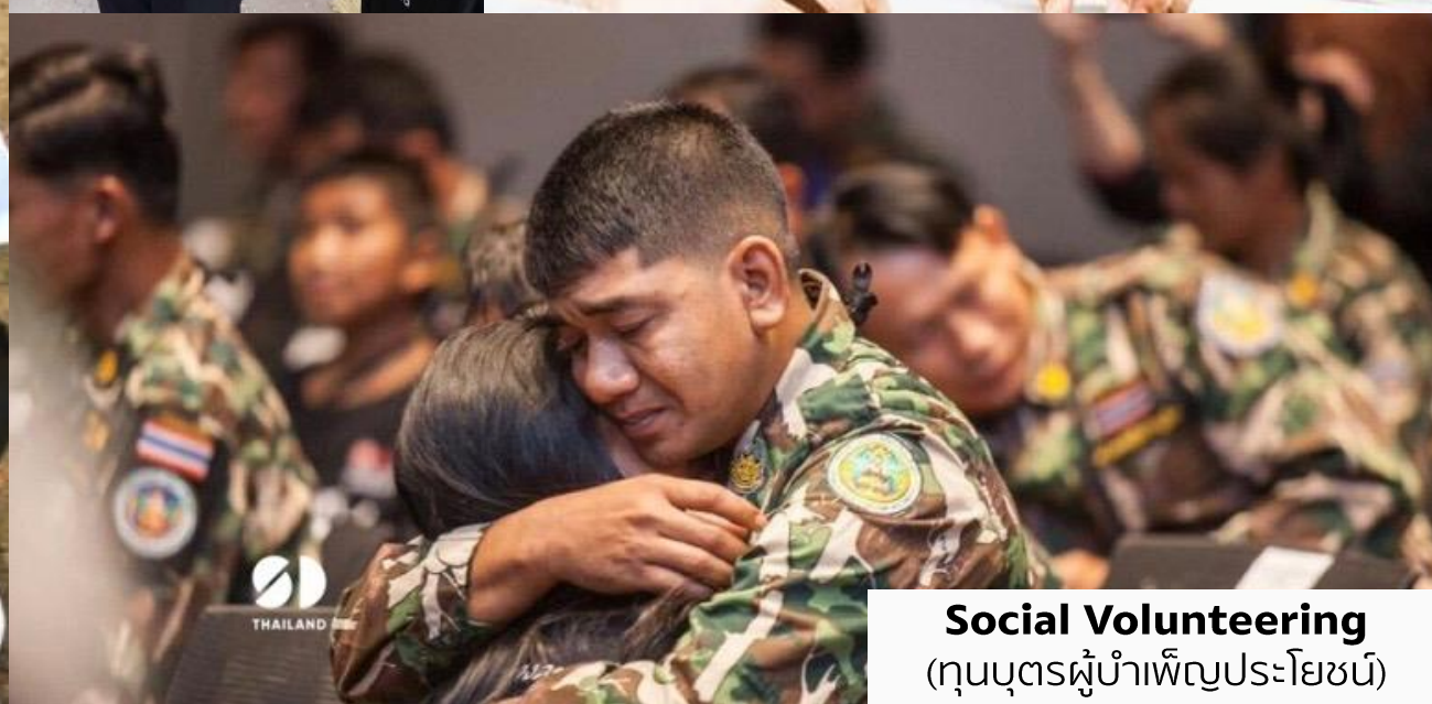
Social Volunteering (คุณบุตรผู้บำเพ็ญประโยชน์)