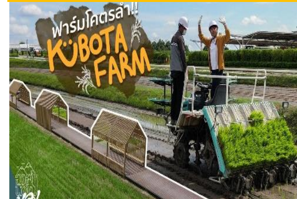
Smart Farming /BIM